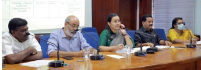
പത്തനംതിട്ട കളക്ടറേറ്റ് കോൺഫറൻസ് ഹാളിൽ ചേർന്ന ചടങ്ങിൽ ആരോഗ്യമന്ത്രി വീണാ ജോർജ്ജ് സംസാരിക്കുന്നു

പത്തനംതിട്ട: ആരോഗ്യ മേഖലയുമായി ബന്ധപ്പെട്ട നിർമ്മാണ പ്രവർത്തനങ്ങൾ സമയബന്ധിതമായി പൂർത്തിയാക്കുന്നതിന് പ്രഥമ പരിഗണന നൽകുമെന്ന് ആരോഗ്യവകുപ്പ് മന്ത്രി വീണാ ജോർജ്ജ് പറഞ്ഞു. പത്തനംതിട്ട കളക്ടറേറ്റ് കോൺഫറൻസ് ഹാളിൽ ചേർന്ന ആരോഗ്യ മേഖലയിലെ നിർമ്മാണ പ്രവർത്തനങ്ങളുമായി ബന്ധപ്പെട്ട അവലോകന യോഗത്തിൽ അധ്യക്ഷത വഹിച്ച് സംസാരിക്കുകയായിരുന്നു മന്ത്രി. പത്തനംതിട്ട ജില്ലയിലെ അഞ്ചു നിയോജകമണ്ഡലങ്ങളിലെയും ആരോഗ്യ മേഖലയിലെ നിർമ്മാണ പ്രവർത്തനങ്ങൾ സംബന്ധിച്ച കാര്യങ്ങൾ ഉദ്യോഗസ്ഥരുമായി ചർച്ച ചെയ്തു. നവ കേരള കർമ്മ പദ്ധതിയുടെ രണ്ടാംഘട്ടത്തിൽ ആർദ്രം പദ്ധതിയിൽ ഉൾപ്പെടുത്തി നടത്തുന്ന ആരോഗ്യ സ്ഥാപനങ്ങളുടെ നവീകരണവും പരിവർത്തനവും സമയബന്ധിതമായി നടപ്പാക്കാൻ ബന്ധപ്പെട്ട ഉദ്യോഗസ്ഥർക്ക് മന്ത്രിയും എംഎൽഎമാരും നി