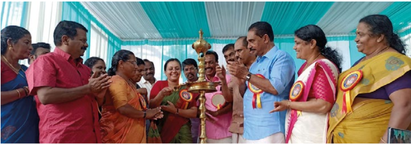
അച്ചൻകോവിലിൽ കുടുംബാരോഗ്യകേന്ദ്രം ആരോഗ്യമന്ത്രി വീണാ ജോർജ്ജ് ഉദ്ഘാടനം ചെയ്യുന്നു. എം പി എൻ കെ പ്രേമചന്ദ്രൻ സമീപം.

കൊല്ലം: സംസ്ഥാനത്തെ മലയോര നിവാസികളുടെ ആരോഗ്യത്തിന് പൂർണ്ണ പരിരക്ഷയും മെച്ചപ്പെട്ട ആരോഗ്യ സേവനങ്ങളും ഉറപ്പാക്കുക എന്ന സർക്കാർ ലക്ഷ്യത്തിന്റെ ഉദാത്ത മാതൃകയാണ് ജില്ലയിലെ മലയോര മേഖലയായ ആരുകാവ് - അച്ചൻകോവിലിൽ പണി പൂർത്തിയാക്കിയ അച്ചൻകോവിലിൽ കുടുംബാരോഗ്യകേന്ദ്രമെന്ന് ആരോഗ്യ വകുപ്പ് മന്ത്രി വീണാ ജോർജ്ജ്. സംസ്ഥാന സർക്കാർ നാഷണൽ ഹെൽത്ത് മിഷൻ മുഖേനയാണ് കുടുംബാരോഗ്യകേന്ദ്രം പണി കഴിപ്പിച്ചത്. സർക്കാർ ആരോഗ്യ മേഖലയിൽ നടപ്പിലാക്കി വരുന്ന സമുലമായ പരിവർത്തനങ്ങളുടെ നേർസാക്ഷ്യം കൂടിയാണ് അച്ചൻകോവിലിൽ കുടുംബാരോഗ്യകേന്ദ്രം. അച്ചൻകോവിലിൽ - ആരുകാവ് നിവാസികളുടെ ചിരകാല അഭിലാഷമായ അച്ചൻകോവിലിൽ കുടുംബാരോഗ്യകേന്ദ്രം ഉദ്ഘാടനം ചെയ്ത് സംസാരിക്കുകയായിരുന്നു മന്ത്രി. ചടങ്ങിൽ അച്ചൻകോവിലിൽ പ്രാഥമികാരോഗ്യ കേന്ദ്രത്തെ സംസ്ഥാന സർക്കാരിന്റെ ആർദ്രം പദ്ധതിയുടെ ഭാഗമായി ആർദ്രം കുടുംബാരോഗ്യ കേന്ദ്രമാക്കി ഉയർ