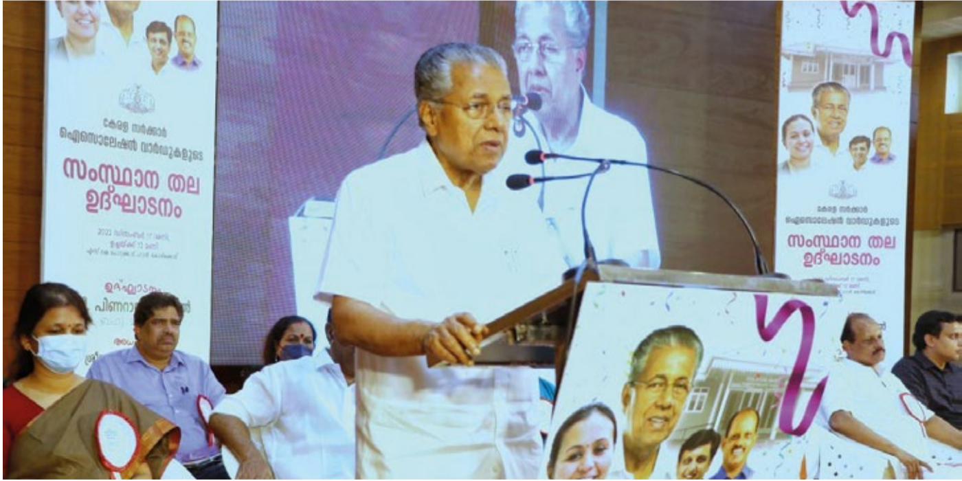
മുഖ്യമന്ത്രി പിണറായി വിജയൻ സംസ്ഥാനത്തെ ഐസൊലേഷൻ വാർഡുകളുടെ ഉദ്ഘാടനം നിർവ്വഹിച്ച് സംസാരിക്കുന്നു

കോഴിക്കോട്: പകർച്ച വ്യാധികളെ തടയുന്നതിൽ നിർണ്ണായക പങ്കു വഹിക്കാൻ ഐസൊലേഷൻ വാർഡുകൾക്ക് സാധിക്കുമെന്നും എല്ലാ മണ്ഡലങ്ങളിലും ഐസൊലേഷൻ വാർഡുകളുടെ നിർമ്മാണം സമയബന്ധിതമായി പൂർത്തിയാക്കുമെന്നും മുഖ്യമന്ത്രി പിണറായി