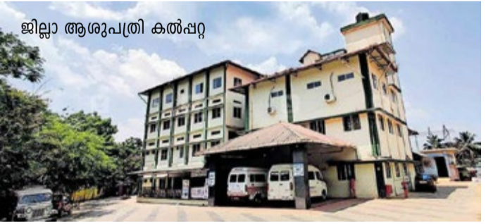
ജില്ലാ ആശുപത്രി കൽപ്പറ്റ

കൽപ്പറ്റ: എല്ലാ മേഖലകളിലും ജില്ല അഭ്യുത്സാഹകമായ വികസന മുന്നേറ്റത്തിനാണ് സാക്ഷ്യംവഹിക്കുന്നത്. ചികിത്സാ സൗകര്യങ്ങളില്ലാത്ത, ആതുരലയങ്ങളും പശ്ചാത്തല സൗകര്യവുമില്ലാത്ത വിദ്യാലയങ്ങളും പൊട്ടിപ്പൊട്ടിഞ്ഞ റോഡുകളും കർഷക ആത്മഹത്യകളുമെല്ലാം പഴക്കമകളായി. നാടിന്റെ സർവതലങ്ങളെയും സ്പർശിച്ച് സർക്കാർ നടപ്പാക്കിയ വികസനപ്രവർത്തനങ്ങളും ജനക്ഷേമപ്രവർത്തനങ്ങളും വയനാടിന്റെ മുഖം തിളക്കമുള്ളതാക്കി. ഈ തിളക്കത്തിന് അടിവരയിടാൻ കൽപ്പറ്റ ജനറൽ ആശുപത്രിയിലേക്ക് വരാം. പദവിയിൽ ജില്ലാ ആശുപത്രിക്കും മുകളിലുള്ള കൽപ്പറ്റ ജനറൽ ആശുപത്രി ഇന്ന് ജില്ലയിൽ ഏറ്റവും മികച്ച ചികിത്സ ലഭിക്കുന്ന സർക്കാർ ആതുരലയമാണ്. സംസ്ഥാന സർക്കാർ ആർദ്രം പദ്ധതിയുടെ ഭാഗമായി നടപ്പാക്കിയ വികസനപ്രവർത്തനങ്ങളാണ് ഈ ആശുപത്രിയുടെ മുഖം മാറ്റിയത്. നേരത്തേ പൊലീസ് സ്റ്റേഷൻ സമീപം ഇടുങ്ങിയ കെട്ടിടത്തിൽ പരിമിത സൗകര്യത്തോടെ പ്രവർത്തിച്ച ആശുപത്രി പ്രവർത്തനം 2016ലാണ് കൈനാട്ടി ജങ്ഷനിലെ നാലുമുന കെട്ടിടത്തിലേക്ക് മാറ്റിയത്. താഴത്തെ