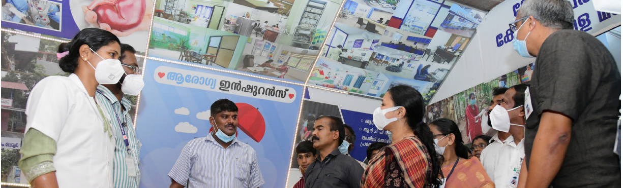
ആരോഗ്യ വകുപ്പ് മന്ത്രി വീണാ ജോർജ്ജ് ആരോഗ്യവകുപ്പിന്റെ സ്റ്റാൾ നോക്കിക്കൊണ്ടുന്നു.

കണ്ണൂർ: സർക്കാരിന്റെ ഒന്നാം വാർഷിക ഘോഷങ്ങളുടെ ഭാഗമായുള്ള 'എന്റെ കേരളം' പ്രദർശന നഗരിയിൽ ആരോഗ്യവകുപ്പിന്റെ സ്റ്റാളിന് മികച്ച പ്രതികരണം. കേരളത്തിലെ ആരോഗ്യ ചരിത്രത്തിന്റെ നാൾ വഴികൾ, കേരളത്തെ പിടിച്ചുകുലുക്കിയ പകർച്ചവ്യാധികൾ, കൊവിഡ് കാലത്തെ അതിജീവനം എന്നിവയുടെ ഫോട്ടോ പ്രദർശനം കഴിഞ്ഞ കാലത്തിന്റെ ഓർമ്മപ്പെടുത്തലായി മാറി. ആർദ്രം മിഷനിലൂടെ കൈവരിച്ച നേട്ടങ്ങൾ, ആരോഗ്യരംഗത്തെ ക്ഷേമപദ്ധതികൾ, സേവനങ്ങൾ, വാക്സിനേഷൻ, ആരോഗ്യ ബോധവൽക്കരണം, ആരോഗ്യ ഇൻഷുറൻസ് എന്നിവയെക്കുറിച്ചുള്ള സചിത്ര വിവരണങ്ങളും സ്പോളിലൊരുക്കിയിരുന്നു. ഫോട്ടോ പ്രദർശനത്തിന് പുറമെ