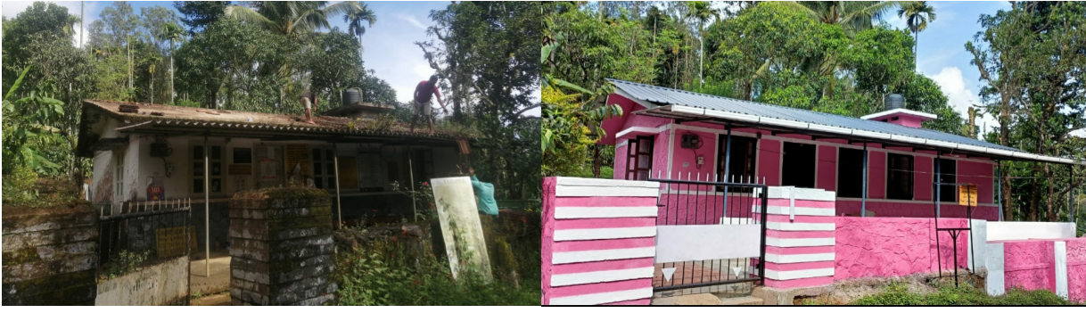
വയനാട്ടിലെ കാലിക്കുനി സബ് സെന്റർ നവീകരണത്തിനു മുൻപും ശേഷവും

ആരോഗ്യക്ഷേമ കേന്ദ്രങ്ങളാവാൻ വയനാട്ടിൽ 204 സബ് സെന്ററുകൾ