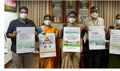
മുതുമുഞ്ജയം കാമ്പയിൻ പോസ്റ്റർ പ്രകാശനം ആരോഗ്യ മന്ത്രി വീണാ ജോർജ്ജ് നിർവഹിക്കുന്നു

തിരുവനന്തപുരം: സംസ്ഥാനത്ത് വ്യാപകമായി മഴ തുടരുന്ന സാഹചര്യത്തിൽ എലിപ്പനിയ്ക്കെതിരെ ആരോഗ്യ വകുപ്പ് 'മുതുമുഞ്ജയം' എന്നപേരിൽ കാമ്പയിൻ ആരംഭിച്ചു. ആരോഗ്യ വകുപ്പ് മന്ത്രി വീണാ ജോർജ്ജ് കാമ്പയിന്റെ ഉദ്ഘാടനവും പോസ്റ്റർ പ്രകാശനവും നിർവഹിച്ചു.