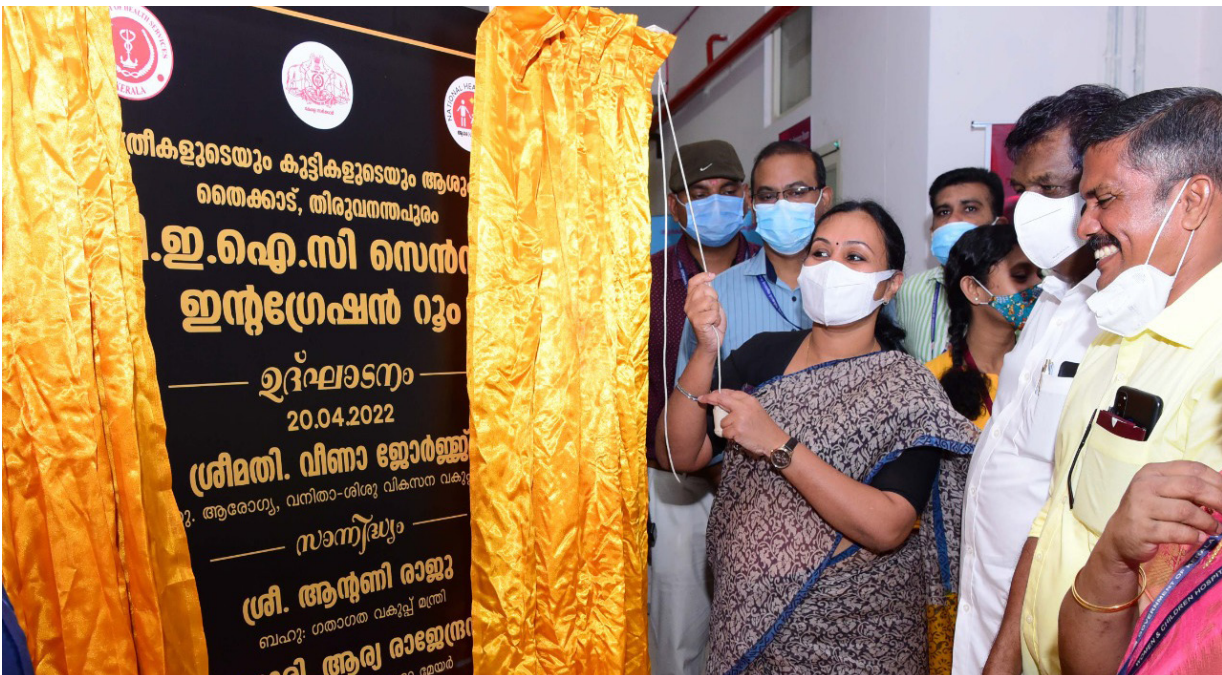
ഡി.ഇ.ഐ.സി. സെൻസറി ഇൻഗ്രേഷൻ റൂമിന്റെ ഉദ്ഘാടനം ആരോഗ്യവകുപ്പ് മന്ത്രി വീണാ ജോർജ്ജ് നിർവഹിക്കുന്നു

തൈക്കാട് ആശുപത്രിയിൽ ഇൻഫർട്ടിലിറ്റി ക്ലിനിക്കിന് സ്വതന്ത്ര യൂണിറ്റാക്കും; 20 ലക്ഷം രൂപയുടെ തൈറോയിഡ് പരിശോധനാ മെഷീൻ