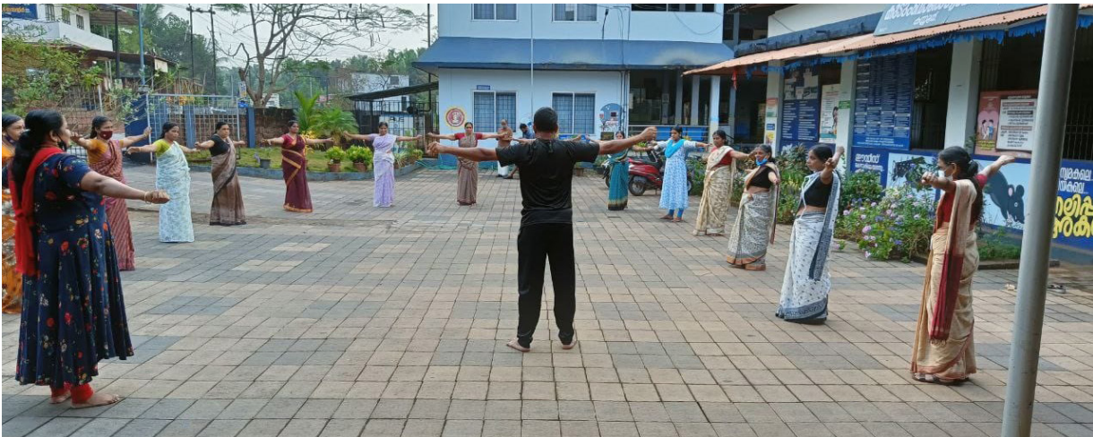
അംഗങ്ങളെ വ്യായാമമുറകൾ പരിശീലിപ്പിക്കുന്നു.

കാസർഗോഡ്: നടന്നു നടന്നു ആരോഗ്യം കൈപ്പിടിയിലൊതുക്കാൻ പുതിയ പദ്ധതിയുമായി കയ്യൂർ-ചീമേനി ഗ്രാമ പഞ്ചായത്തും കയ്യൂർ കുടുംബാരോഗ്യ കേന്ദ്രവും. 'മിടിപ്പ്' എന്ന ജീവിത ശൈലീരോഗ നിയന്ത്രണ പരിപാടിയിലൂടെ 16 വാർഡുകളിലും വ്യായാമ ക്ലബ്ബ് രൂപീകരിച്ച് നല്ല ആരോഗ്യശീലങ്ങൾ വളർത്തിയെടുക്കുകയാണ് പദ്ധതിയുടെ ലക്ഷ്യം.