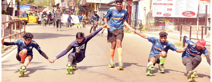
വിവ കേരളം ക്യാമ്പയിന്റെ ഭാഗമായി സംഘടിപ്പിച്ച സ്കേറ്റിംഗ്