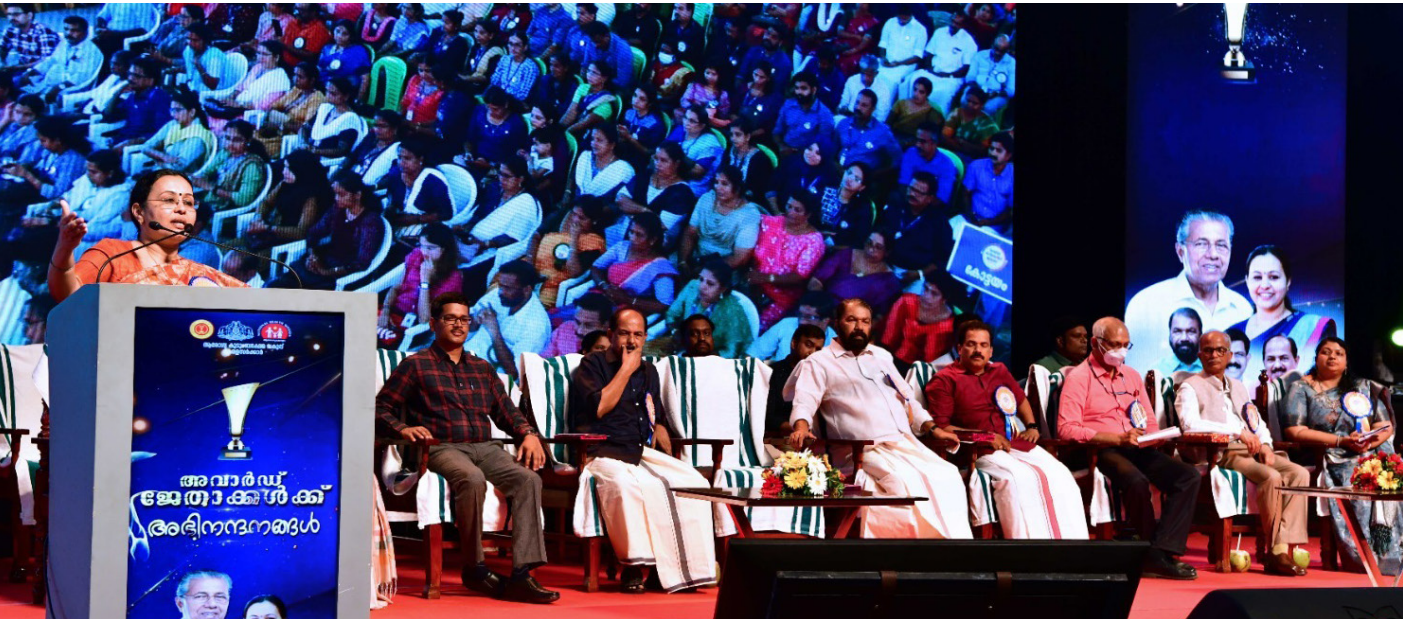
കായകൽപ്പ പുരസ്കാര വിതരണ ചടങ്ങ് ആരോഗ്യവും വനിതാ ശിശുവികസനവും വകുപ്പ് മന്ത്രി വീണാ ജോർജ്ജ് ഉദ്ഘാടനം ചെയ്ത് സംസാരിക്കുന്നു. മന്ത്രിമാരായ വി. ശിവൻകുട്ടി, ജി. ആർ. അനിൽ, ആരോഗ്യവകുപ്പ് ഉദ്യോഗസ്ഥർ എന്നിവർ സമീപം.

തിരുവനന്തപുരം: ആരോഗ്യ പ്രവർത്തകർക്ക് നേരെയുള്ള ആക്രമണം തടയാൻ സംസ്ഥാന സർക്കാർ ശക്തമായ നിയമ നിർമ്മാണം നടത്തുമെന്ന് ആരോഗ്യവും വനിതാശിശു വികസനവും വകുപ്പ് മന്ത്രി വീണാ ജോർജ്ജ്. എല്ലാ വശങ്ങളും പരിശോധിച്ചു എത്രയും വേഗം നടപ്പിലാക്കുന്നതാണ്. ആരോഗ്യ പ്രവർത്തകർക്ക് നേരെയുള്ള ആക്രമണങ്ങൾ നിർഭയാലാക്കിയാണ്. അതവരുടെ മനോവിദ്വേഗം തകർക്കും. ആരോഗ്യ പ്രവർത്തകർക്ക് നേരെയുള്ള ആക്രമണങ്ങൾ ഒറ്റക്കെട്ടായി ചെറുക്കണമെന്നും മന്ത്രി അഭ്യർത്ഥിച്ചു. 2021-22 വർഷത്തിലെ സംസ്ഥാന കായകൽപ്പ പുരസ്കാരം പരിപാടിയുടെ ഉദ്ഘാടനവും അവാർഡ് വിതരണവും നിരീക്ഷിക്കാൻ ഓഡിറ്റോറിയത്തിൽ നിർവഹിച്ച സംസാരിക്കുകയായിരുന്നു മന്ത്രി. സംസ്ഥാനത്തെ എല്ലാ ആരോഗ്യ സ്ഥാപനങ്ങളിലും ഇ ഹെൽത്ത് സംവിധാനമാറുകയാണ് ലക്ഷ്യമിടുന്നത്. 540 ഓളം സ്ഥാപനങ്ങളിൽ ഇ ഹെൽത്ത് നടപ്പിലാക്കിയിട്ടുണ്ട്. ഇതിലൂടെ പേപ്പർ രഹിത ആശുപത്രി സേവനം സാധ്യമാക്കാനും ഓൺ