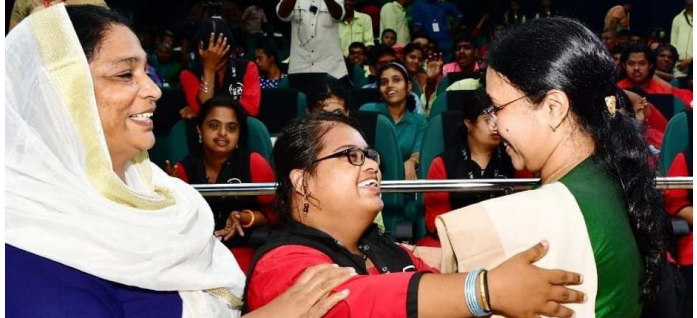
മാജിക് പ്ലാനറ്റിൽ എത്തിയ ആരോഗ്യമന്ത്രി വീണാ ജോർജ്ജ് കുട്ടികൾക്കൊപ്പം.

തിരുവനന്തപുരം: സംസ്ഥാനത്ത് 18 വയസിന് താഴെയുള്ള എല്ലാ ദിനശേഷി കുട്ടികൾക്കും സൗജന്യ സമഗ്ര ദന്തചികിത്സ ലഭ്യമാക്കുമെന്ന് ആരോഗ്യവും വനിതാശിശു വികസനവും വകുപ്പ് മന്ത്രി വീണാ ജോർജ്ജ്. എല്ലാ തരത്തിലുള്ള മൈനറും മേജറുമായിട്ടുള്ള ഓരോ സർജറി പ്രൊസീജിയറുകൾ, ഓർത്തോഡന്റാറ്റിക് സർജറി, കോസ്റ്റലിക് സർജറി, മോണ സംബന്ധമായ പ്രശ്നങ്ങൾ, ദന്തക്രമീകരണം, പല്ല് നഷ്ടപ്പെട്ട കുട്ടികൾക്ക് പല്ല് വയ്ക്കൽ തുടങ്ങിയ എല്ലാം സൗജന്യമായി ചെയ്തുകൊടുക്കുമെന്നും മന്ത്രി പറഞ്ഞു. ലോക വനരോഗ്യ ദിനാചരണത്തിന്റെ സംസ്ഥാനതല ഉദ്ഘാടനം തിരുവനന്തപുരം മാജിക് പ്ലാനറ്റിൽ നിർവഹിച്ചു സംസാരിക്കുകയായിരുന്നു മന്ത്രി. നമ്മുടെ ശരീരത്തിലെ മറ്റ് രോഗങ്ങളുമായി കൂടി ദന്തരോഗം ബന്ധപ്പെട്ടിരിക്കുന്നു. പ്രമേഹം, രക്തസമ്മർദ്ദം, പക്ഷാഘാതം തുടങ്ങിയ വിവിധ രോഗങ്ങൾ ദന്തരോഗവുമായി ബന്ധപ്പെട്ടതാണ്. ദേശീയ ആരോഗ്യ പരിപാടിക്ക് കീഴിൽ ആരോഗ്യത്തിനും വദന സംരക്ഷണത്തിനും മാതൃകാപരമായ പ്രവർത്തനങ്ങളാണ് കേരളം നടത്തുന്നത്. മാർച്ച് 20 മുതൽ