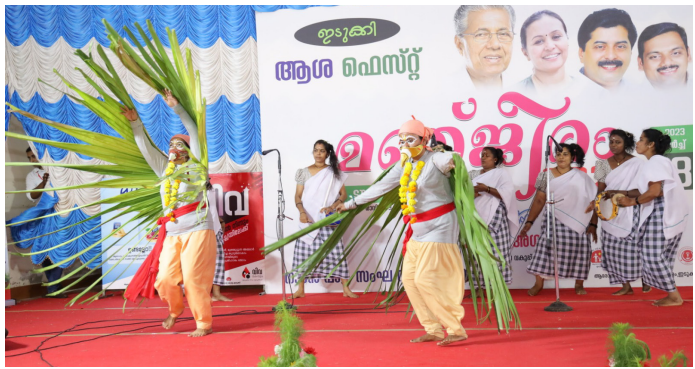
ആശംഹെസ്റ്റിൽ അവതരിപ്പിച്ച സംഘനൃത്തം

ഇടുക്കി: ആർദ്രം വിളിയും, ആഘോഷവുമായി ജില്ലാ ആശംഹെസ്റ്റ് മഞ്ജീരം. കാണിക്കളെ അവരോടൊന്നിച്ച് ചട്ടുലമ്പലത്തുണ്ടും പാട്ടുകളുമായി ആശംഹെസ്റ്റ് കീഴടക്കി. ചെറുതോണി ടൗൺഹാളിൽ നടന്ന പരിപാടി ജലവിഭവ വകുപ്പ് മന്ത്രി റോഷി അഗസ്റ്റിൻ ഉദ്ഘാടനം ചെയ്തു. എം.പി. അഡ്വ. ഡീൻ കുമാരകോട് അദ്ധ്യക്ഷനായി. ജില്ലയിലെ ആശംഹെസ്റ്റിന്റെ പ്രവർത്തനങ്ങൾ വളരെയേറെ അഭിനന്ദനം അർഹിക്കുന്നതാണെന്നും അവരുടെ പ്രവർത്തനങ്ങൾ വളരെയേറെ ആത്മാർത്ഥതയോടെയാണെന്നും മന്ത്രി ഉദ്ഘാടന ചടങ്ങിൽ പറഞ്ഞു.