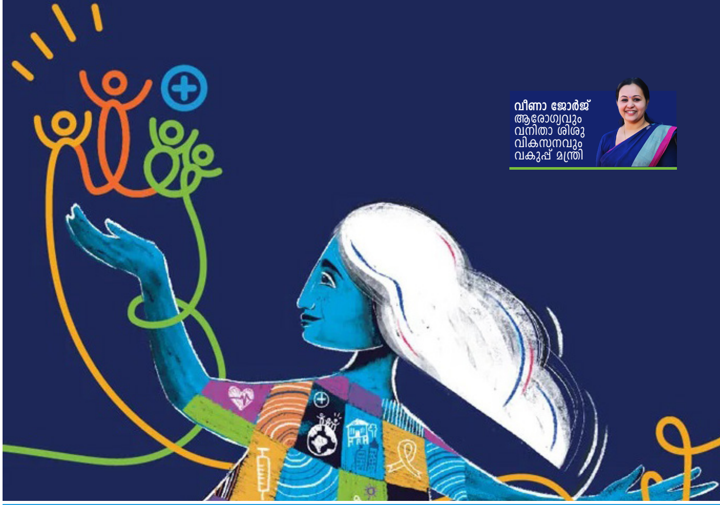
വീണാ ജോർജ്ജ് ആരോഗ്യവും വനിതാ ശിശു വികസനവും വകുപ്പ് മന്ത്രി