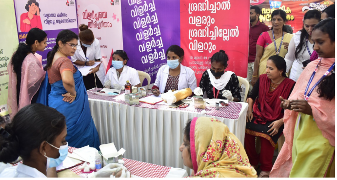
വിവാ ക്യാമ്പയിന്റെ ഭാഗമായി നടന്ന വിളർച്ച പരിശോധന