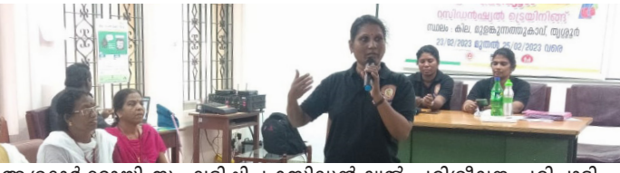
ആശംഹെസ്റ്റിനെ സംബന്ധിച്ച് പരിശീലന പരിപാടിയിൽ പാലീസ് ഉദ്യോഗസ്ഥ ക്ലാസ്സെടുക്കുന്നു.

തൃശൂർ: ആശംഹെസ്റ്റിനെ സംബന്ധിച്ച് പരിശീലനം കൂടുതൽ കാര്യക്ഷമമാക്കാനും അവരുടെ പ്രവർത്തനം മെച്ചപ്പെടുത്താനുമായി നവംബർ 2023 ജില്ലാ ആശംഹെസ്റ്റിനെ സംബന്ധിച്ച് തൃശൂർ ജില്ലാ ആരോഗ്യകേരളം. ബന്ധം മൊഡ്യൂൾ പരിശീലനമാണ് ആശംഹെസ്റ്റർ നവംബർ 2023 ജില്ലാ ആശംഹെസ്റ്റിനെ സംബന്ധിച്ച് തൃശൂർ ജില്ലാ ആരോഗ്യകേരളം. ബന്ധം മൊഡ്യൂൾ പരിശീലനമാണ് ആശംഹെസ്റ്റർ നവംബർ 2023 ജില്ലാ ആശംഹെസ്റ്റിനെ സംബന്ധിച്ച് തൃശൂർ ജില്ലാ ആരോഗ്യകേരളം.