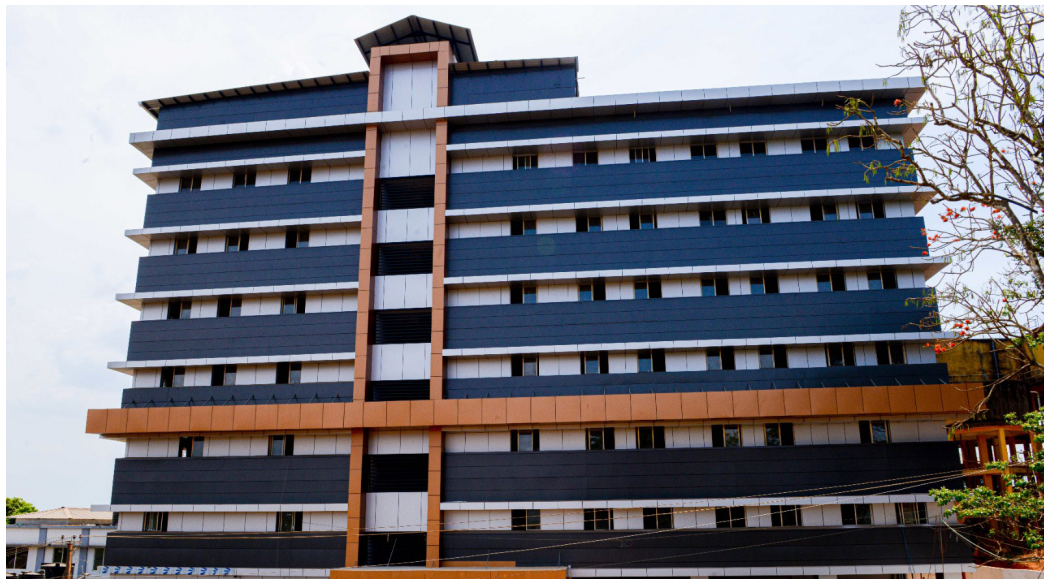
മാനന്തവാടി വയനാട് ഗവ. മെഡിക്കൽ കോളേജിൽ ഉദ്ഘാടനത്തിന് തയ്യാറായ മൾട്ടി പർപ്പസ് ബ്ലോക്ക്

വാളിങ്ങ്, ഓഡിയോ സിസ്റ്റം, എയർകണ്ടീഷൻ, ഫ്രണ്ട് ഓഫീസ് റിസപ്ഷൻ കൗണ്ടർ, മാർബിൾ ടോപ്പ് വർക്കിങ്ങ് ടേബിളുകൾ, ഡയസ്, 100 പേർക്കുള്ള സീറ്റിംഗ് കപ്പാസിറ്റി, പാൻട്രി ഏരിയ, മെയിൽ/ഫീമെൽ വാഷ് ഏരിയകൾ എന്നീ സൗകര്യങ്ങൾ ഉൾപ്പെടുത്തിയിട്ടുണ്ട്.