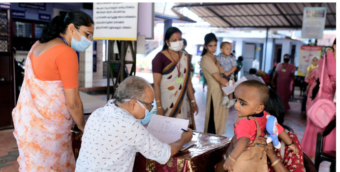
ലിറ്റിൽ ചാമ്പ് മത്സരത്തിൽ പങ്കെടുക്കുന്ന കുഞ്ഞുങ്ങളുടെ ആരോഗ്യ പരിശോധന നടത്തുന്നു.

തൃശ്ശൂർ: ശൈശവാരോഗ്യം ലക്ഷ്യമിട്ട് വ്യത്യസ്തമാർന്നൊരു പരിപാടിയുമായി ജില്ലാ ആരോഗ്യ വകുപ്പ്. കുഞ്ഞുങ്ങളുടെ സമഗ്ര