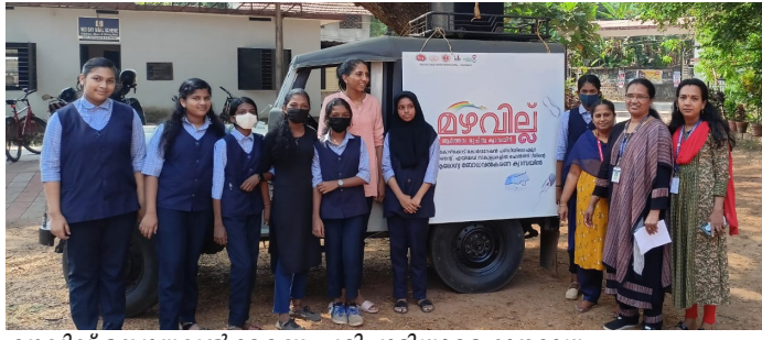
മഴവില്ല് ബോധവൽക്കരണ പരിപാടിയുടെ ഭാഗമായ ആരോഗ്യപ്രവർത്തകർ വിദ്യാർത്ഥിനികൾക്കൊപ്പം.

കോഴിക്കോട്: ആർത്തവ ശുചിത്വ സന്ദേശവുമായി ആരോഗ്യ വകുപ്പും ദേശീയ ആരോഗ്യ ഭൗതികവും സംയുക്തമായി 'മഴവില്ല്' ആർത്തവ ശുചിത്വ ക്യാമ്പയിൻ ആരംഭിച്ചു. ക്യാമ്പയിന്റെ ഭാഗമായി കോഴിക്കോട് കോർപ്പറേഷൻ പരിധിയിലെ 29 സർക്കാർ എയ്ഡഡ് സ്കൂളുകളിൽ പരിശീലനം ലഭിച്ച ആരോഗ്യ പ്രവർത്തകർ അടങ്ങുന്ന സംഘം വാഹന പ്രചരണം നടത്തി. പാലൂക്കളുടെ ഉപയോഗം, മെൻസ് ട്രാവൽ ക്ലപ്പുകളുടെ ഉപയോഗം, യഥാസമയം ഇവ മാറ്റുന്നതിന്റെ ആവശ്യകത, ഇവയുടെ നിർമ്മാർജ്ജനം എന്നീ സന്ദേശങ്ങളാണ് സംഘം പെൺകുട്ടികൾക്കായി നൽകുന്നത്. സർവ്വീസ് ജെ.പി.എച്ച്. എൻമാർ, അർബൻ ജെ.പി.എച്ച്.എൻമാർ, ആർ.ബി.എസ്.