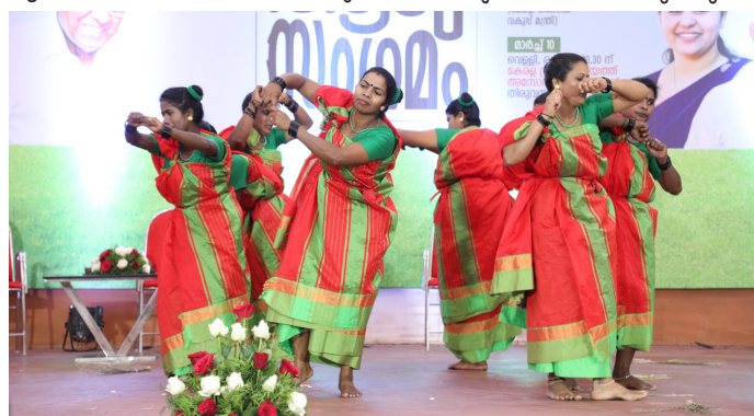
ഹാംലെറ്റ് ആശമാർ അവതരിപ്പിച്ച സംഘനൃത്തം

ആശ ഐഇസി കിറ്റ്, ആശമാരുടെ പ്രഥമശുശ്രൂഷാ കിറ്റായ കരുതൽ കിറ്റ് വിതരണത്തിന്റെ ഉദ്ഘാടനവും ചടങ്ങിൽ നടന്നു. വിവിധ ജില്ലകളിൽ നിന്നെത്തിയ ആശമാർ തനത് വേഷത്തിലും