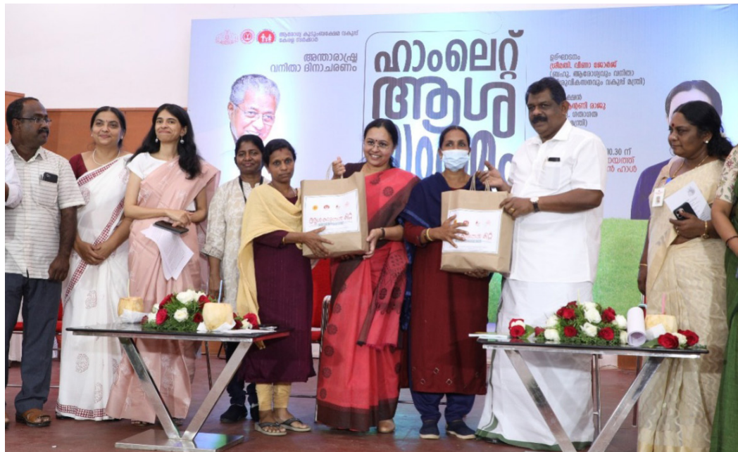
ആശാ ഡ്രഗ് കിറ്റ് വിതരണം ആരോഗ്യവകുപ്പ് മന്ത്രി വീണാ ജോർജ്ജ് ഗതാഗതവകുപ്പ് മന്ത്രി ആന്റണി രാജു എന്നിവർ ചേർന്ന് നിർവ്വഹിക്കുന്നു.

തിരുവനന്തപുരം: ആദിവാസി ജനവിഭാഗങ്ങളുടെ ആരോഗ്യം മെച്ചപ്പെടുത്തുന്നതിന് വേണ്ടി ഊരുമിത്രം പ്രവർത്തിക്കുന്ന ആശാ പ്രവർത്തകരുടെ സേവനം എല്ലാ ജില്ലകളിലും വ്യാപിപ്പിക്കുമെന്ന് ആരോഗ്യവും വനിതാശിശു വികസനവും വകുപ്പ്