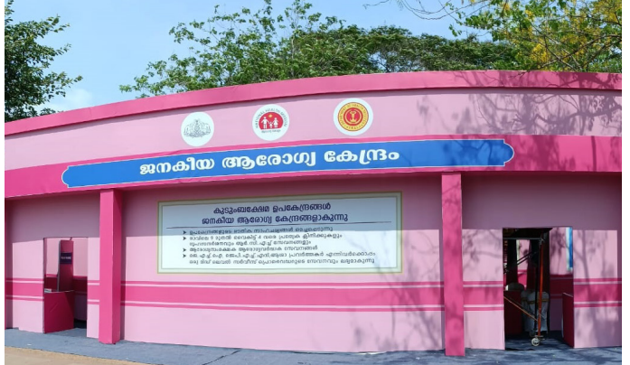
കായകൽപ്പ പുരസ്കാര വിതരണത്തിന്റെ ഭാഗമായി ഒരുക്കിയ ജനകീയാരോഗ്യ കേന്ദ്രത്തിന്റെ മാതൃക