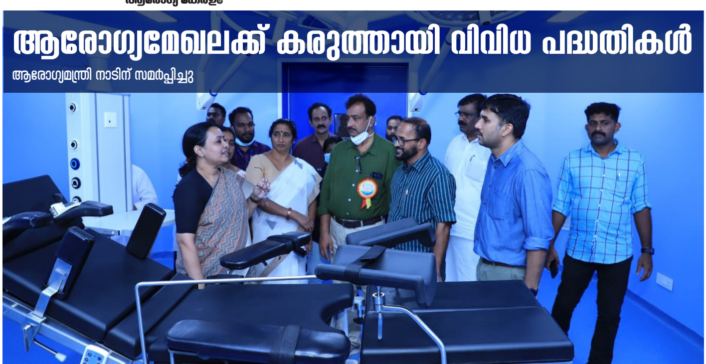
അമ്മയും കുഞ്ഞും ആശുപത്രിയിൽ എത്തിയ ആരോഗ്യമന്ത്രി വീണാ ജോർജ് മോഡുലാർ ഓപ്പറേഷൻ തിയേറ്റർ സന്ദർശിക്കുന്നു