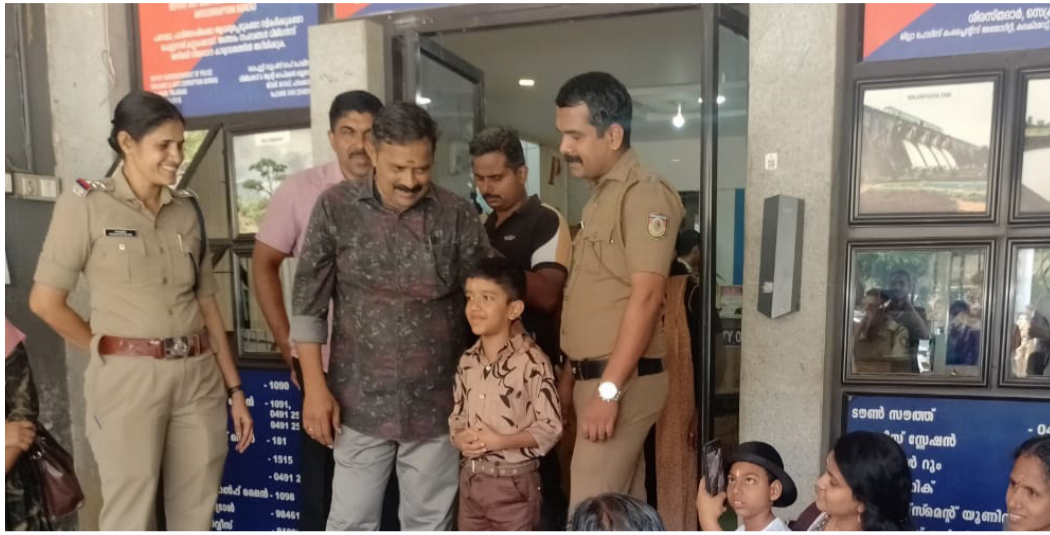
ഓട്ടിസം ദിനാചരണത്തിന്റെ ഭാഗമായി കുട്ടികളും രക്ഷിതാക്കളും ജനമൈത്രി പൊലീസ് സ്റ്റേഷൻ സന്ദർശിച്ചപ്പോൾ

പാലക്കാട്: ഓട്ടിസം ബാധിതരുടെ അവകാശങ്ങൾ തിരിച്ചറിയുന്നതിനും ആഘോഷിക്കുന്നതിനുമായി ഓട്ടിസം ബാധിച്ച കുഞ്ഞുങ്ങളുടെയും രക്ഷിതാക്കളുടെയും പുണ്യമായ ഒത്തുചേരൽ ഒരുക്കി പാലക്കാട് ജില്ലാ പ്രാരംഭ ഇടപെടൽ കേന്ദ്രത്തിലെ ജീവനക്കാർ. കുഞ്ഞുങ്ങളിലെ വളർച്ചയിലുള്ള കാലതാമസവും ജനന വൈകല്യങ്ങളും കണ്ടെത്തി ഉചിതമായ ഇടപെടൽ നടത്തുന്നതിനുള്ള കേന്ദ്രമായ ഡി.ഇ.ഐ.സിയിലെ ഗുണഭോക്താക്കളായ ഇരുപതോളം കുഞ്ഞുങ്ങളും രക്ഷിതാക്കളുമാണ് പരിപാടിയിൽ പങ്കു ചേർന്നത്. രാവിലെ 10 മണിയോടെ ഡിഇഐസിയിൽ പാട്ടും ഡാൻസും ചെയ്ത കളികളുമായി ഒത്തുചേർന്ന സംഘം പിന്നീട് പാലക്കാട് ജനമൈത്രി പൊലീസ് സ്റ്റേഷൻ സന്ദർശിച്ചു. ഓട്ടിസം ബാധിതർക്ക് അനുകൂലമായ നിയമപരിപക്ഷയെ കുറിച്ചും രക്ഷിതാക്കൾ അറിഞ്ഞിരിക്കേണ്ട പ്രധാന കാര്യങ്ങൾ സംബന്ധിച്ചും സിവിൽ പൊലീസ് ഓഫീസർ വിശദീകരിച്ചു. പൊതുസമൂഹത്തിൽ നിന്നും നേരിടേണ്ടി വരുന്ന