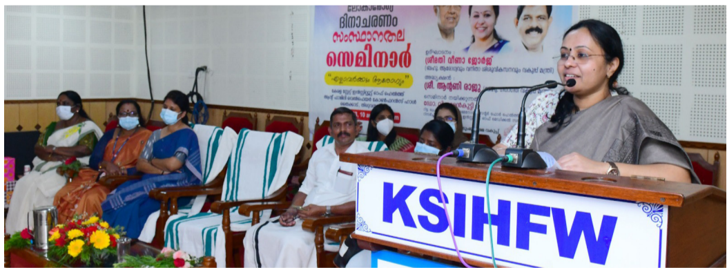
ലോകാരോഗ്യ ദിനാചരണം സംസ്ഥാനതല ഉദ്ഘാടനം ആരോഗ്യവകുപ്പ് മന്ത്രി വീണാ ജോർജ്ജ് ഉദ്ഘാടനം നിർവഹിക്കുന്നു

ദേശീയ തലത്തിലും സംസ്ഥാന തലത്തിലുമുള്ള ഗുണനിലവാര പുരസ്കാരങ്ങളായ എൻഎബിഎച്ച്, എൻ ക്യാ എസ്, കായൽപ്പ, ലക്ഷ്യ, മദർ ആൻഡ് ബേബി പ്രണ്ട്ലി ഹോസ്പിറ്റൽ സർട്ടിഫിക്കേഷൻ എന്നിവ സ്വന്തമാക്കിയ എറണാകുളം ജനറൽ ആശുപത്രി കൂടുതൽ മെച്ചപ്പെട്ട സേവനങ്ങൾ ലഭ്യമാവുന്ന കേന്ദ്രമായി മാറുകയാണ്.