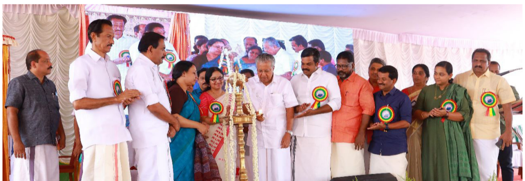
കോന്നി മെഡിക്കൽ കോളേജ് അക്കാദമിക് ബ്ലോക്ക് മുഖ്യമന്ത്രി പിണറായി വിജയൻ ഉദ്ഘാടനം ചെയ്യുന്നു

കോന്നി മെഡിക്കൽ കോളേജ് അക്കാദമിക് ബ്ലോക്ക് നാടിനു സമർപ്പിച്ചു