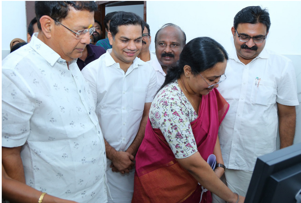
എറണാകുളം ജനറൽ ആശുപത്രിയിലെ വിവിധ പദ്ധതികളുടെ ഉദ്ഘാടനം ആരോഗ്യമന്ത്രി വീണാ ജോർജ്ജ് നിർവഹിക്കുന്നു

സംസ്ഥാനതലത്തിൽ നടക്കുന്ന പല പരിപാടികളിലും അവസരം നൽകുകയും ടീമിനെ കൂടുതൽ ശക്തമാക്കാനും പരിപോഷിപ്പിക്കാനും ആവശ്യമായ പ്രോത്സാഹനം നൽകുകയും ചെയ്തത് വിസ്മരിക്കാവുന്നതല്ല.