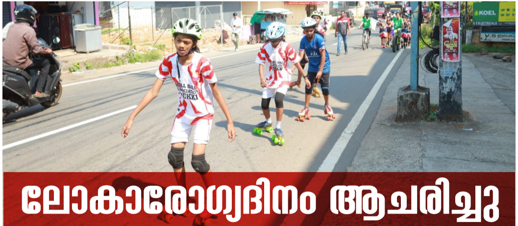
ലോകാരോഗ്യദിനത്തിന്റെ ഭാഗമായി വിദ്യാർത്ഥികളുടെ നേതൃത്വത്തിൽ നടന്ന സ്കേറ്റിംഗ്

കാസർഗോഡ് വികസന പാക്കേജിൽ 2015-16 സാമ്പത്തിക വർഷം അനുവദിച്ച 1.50 കോടി രൂപ ഉപയോഗിച്ചാണ് ജില്ലാ ആശുപത്രിയിൽ സി എസ് എസ് ഡി യുടെ പ്രവർത്തി പൂർത്തിയാക്കിയത്. സർജറി, കാത്ത് ലാബ് തുടങ്ങിയ ഡിപ്പാർട്ട്മെന്റുകളിലേക്ക് അണുവിമുക്തമായ ഉപകരണങ്ങൾ കൃത്യ സമയത്ത് വിതരണം ചെയ്യുന്നതിന് വേണ്ടിയാണ് സെൻട്രൽ സ്റ്റോറിൽ സപ്ലൈ ഡിപ്പാർട്ട്മെന്റ്, സി എസ് എസ് ഡി ആരംഭിക്കുന്നതോട് കൂടി ആശുപത്രിയിലെ മുഴുവൻ ഉപകരണങ്ങളും ഒറ്റ ഷിഫ്റ്റിൽ കുറഞ്ഞ മാനവശേഷിയുടെ അതിവേഗത്തിൽ അണുവിമുക്തമാക്കാൻ സാധിക്കും. സ്ത്രീകളുടെയും കുട്ടികളുടെയും ആശുപത്രിയിൽ ഒരേ സമയം 60 പേരെ കിടത്തി ചികിത്സിക്കുവാനുള്ള സൗക