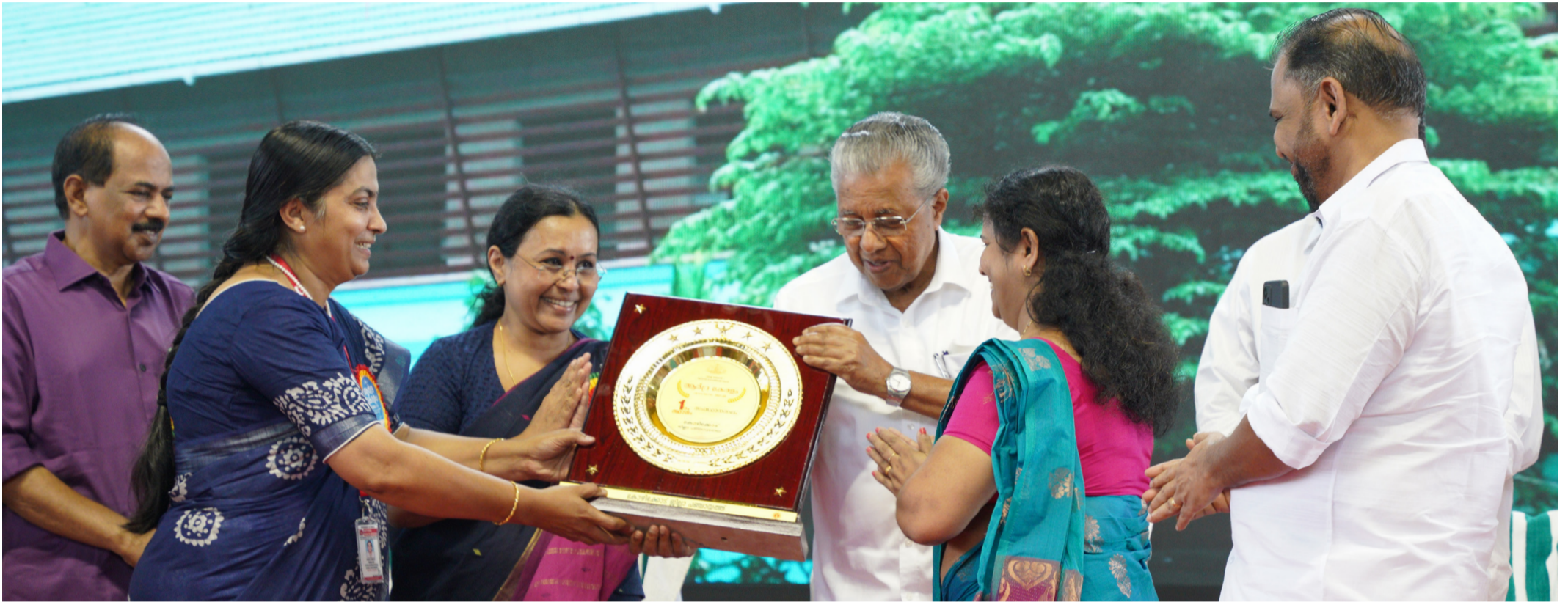
ആർദ്രകേരളം പുരസ്കാര വിതരണം മുഖ്യമന്ത്രി പിണറായി വിജയൻ നിർവ്വഹിക്കുന്നു