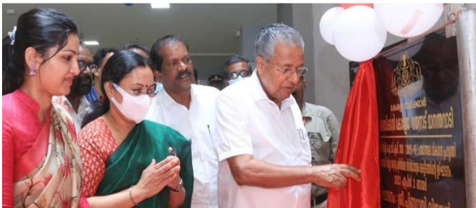
മെഡിക്കൽ കോളേജിൽ പുതുതായി നിർമ്മിച്ച കാത്ത് ലാബിന്റെയും മറ്റ് സ്പെഷ്യാലിറ്റി കെട്ടിടത്തിന്റെയും ശിലാസ്ഥാപന കർമ്മം മുഖ്യമന്ത്രി പിണറായി വിജയൻ നിർവ്വഹിക്കുന്നു. ആരോഗ്യമന്ത്രി വീണാ ജോർജ്ജ് സമീപം.

മാനന്തവാടി: വയനാട് മെഡിക്കൽ കോളേജ് വികസനത്തിനായുള്ള മാസ്റ്റർ പ്ലാൻ സർക്കാരിന്റെ പരിഗണനയിലുണ്ടെന്ന് മുഖ്യമന്ത്രി പിണറായി വിജയൻ. മെഡിക്കൽ കോളേജിൽ പുതുതായി നിർമ്മിച്ച കാത്ത് ലാബിന്റെയും മറ്റ് സ്പെഷ്യാലിറ്റി കെട്ടിടത്തിന്റെയും ഉദ്ഘാടനം നിർവ്വഹിക്കുകയായിരുന്നു അദ്ദേഹം. വയനാടിന്റെ സമഗ്ര മുന്നേറ്റം ലക്ഷ്യമാക്കിയുള്ള നിരവധി പദ്ധതികളാണ് സർക്കാർ നടപ്പാക്കുന്നത്. ആദിവാസി വിഭാഗങ്ങൾക്കു വേണ്ടിയുള്ള പ്രത്യേക ആരോഗ്യ പദ്ധതികളും നടപ്പിലാക്കി വരികയാണ്. ആദിവാസി