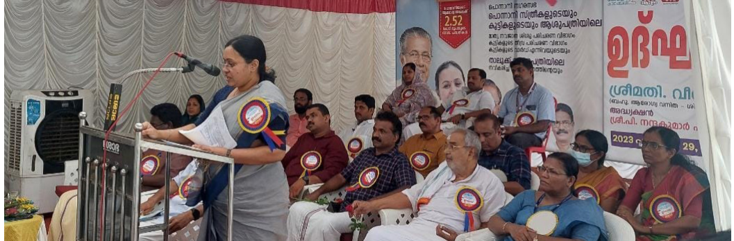
മലപ്പുറം ജില്ലയിൽ ആരംഭിച്ച വിവിധ പദ്ധതികളുടെ ഉദ്ഘാടനം ആരോഗ്യവും വനിതാ ശിശു വികസനവും വകുപ്പ് മന്ത്രി വീണാ ജോർജ് നിർവ്വഹിക്കുന്നു.

മലപ്പുറം: സർക്കാരിന്റെ നൂറ് ദിന കർമ്മപരിപാടിയുടെ ഭാഗമായി ആരോഗ്യമേഖലയിൽ 12.13 കോടിയുടെ പദ്ധതികൾ ആരോഗ്യവകുപ്പ് മന്ത്രി വീണാ ജോർജ് നാടിന് സമർപ്പിച്ചു. മഞ്ചേരി മെഡിക്കൽ കോളേജ്, പൊന്നാനി സ്ത്രീകളുടെയും കുട്ടികളുടെയും ആശുപത്രി, മലപ്പുറം താലൂക്കാശുപത്രി, ബ്ലോക്ക് കുടുംബാരോഗ്യ കേന്ദ്രം ചുരുത്തു, പൊന്നാനി താലൂക്കാശുപത്രി, എടപ്പാൾ സാമൂഹികാരോഗ്യകേന്ദ്രം, കുറ്റിപ്പുറം താലൂക്കാശുപത്രി തുടങ്ങിയ ആശുപത്രികളിലെ പുർത്തിയായ പദ്ധതികളാണ് ആരോഗ്യമന്ത്രി നാടിന് സമർപ്പിച്ചത്. കോവിഡ് എമർജൻസി ഫണ്ട് ഉപയോഗിച്ച് തയ്യാറാക്കിയ പീഡിയാട്രിക് കെയർ യൂണിറ്റ് വിത്ത് നെഗറ്റീവ് പ്രഷർ സിസ്റ്റം (4 ബെഡ് ഐ.സി. യു, 8 ബെഡ് എച്ച്.ഡിയു, 30 ബെഡ് വാർഡ് തുടങ്ങിയവയും, റാമ്പും, എഫ്ലൂവെന്റ് ട്രീറ്റ്മെന്റ് പ്ലാന്റ്, കൗൺസിലർ ഫണ്ട്, ക്യാഷാലിറ്റി റിനോവേഷൻ അടക്കം 7.08 കോടിയുടെ പദ്ധതികളാണ് മഞ്ചേരി മെഡിക്കൽ കോളേജിൽ ഉദ്ഘാടനം ചെയ്തത്. മലപ്പുറം താലൂക്കാശുപത്രിയിൽ 84.25 ലക്ഷം രൂപ കോവിഡ് എമർജൻസി ഫണ്ട് ഉപയോഗിച്ച് തയ്യാറാക്കിയ 5 ബെഡ് ഐ.സി. യൂണിറ്റിന്റെയും കെ.എം.സി.എൽ നിർമ്മിക്കുന്ന കാരുണ്ണ ഫാർമസിയും മന്ത്രി ഉദ്ഘാടനം ചെയ്തു. 74 ആ മത് കാരുണ്ണ കമ്മ്യൂണിറ്റി ഫാർമസി ആണിത്. ജില്ലയിലെ ആദ്യത്തെ എം.എൻ.സി.യു പൊന്നാനി സ്ത്രീകളുടെയും കുട്ടികളുടെയും ആശുപത്രിയിൽ തയ്യാറാക്കിയിട്ടുണ്ട്. ഇതിന്റെ ഉദ്ഘാടനവും മന്ത്രി നിർവഹിച്ചു. ഇതുകൂടാതെ പീയിട്രിക് കെയർ യൂണിറ്റ് വിത്ത് നെഗറ്റീവ് പ്രഷർ സിസ്റ്റം 6 എച്ച്ഡിയു, 15