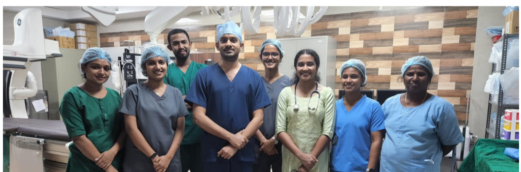
കാത്ത് ലാബിൽ പ്രവർത്തിക്കുന്ന ഡോക്ടർമാരും നേഴ്സുമാരും അടങ്ങുന്ന സംഘം