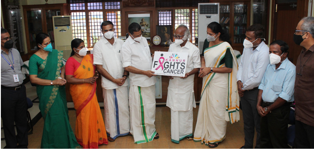
ക്യാമ്പയിനിന്റെ ലോഗോ പ്രകാശനം തദ്ദേശ സ്വയംഭരണ- എക്സൈസ് വകുപ്പ് മന്ത്രി എം.വി ഗോവിന്ദൻ മാസ്റ്റർ നിർവ്വഹിക്കുന്നു.

കണ്ണൂർ: കാൻസർ പ്രതിരോധം, ചികിത്സ എന്നിവയെക്കുറിച്ച് ജനങ്ങൾക്ക് അവബോധം നൽകുന്നതിനായി ജില്ലാ ഭരണകൂടം, ജില്ലാ പഞ്ചായത്ത്, ജില്ലാ ആരോഗ്യവകുപ്പ് എന്നിവയുടെ സംയുക്ത പങ്കാളിത്തത്തോടെ 'കണ്ണൂർ ഫൈറ്റ്സ് കാൻസർ' ക്യാമ്പയിൻ ആരംഭിച്ചു. ക്യാമ്പയിൻ്റെ ലോഗോ പ്രകാശനം തദ്ദേശ സ്വയംഭരണ- എക്സൈസ് വകുപ്പ് മന്ത്രി എം.വി ഗോവിന്ദൻ മാസ്റ്റർ നിർവ്വഹിച്ചു.