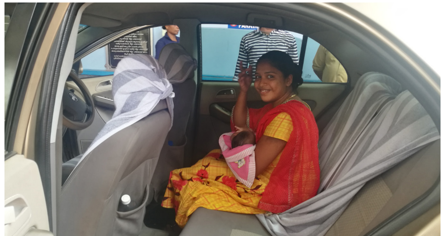
നെയാറ്റിൻകര ജനറൽ ആശുപത്രിയിൽ ഡിസ്ചാർജായ അമ്മയും കുഞ്ഞും കാറിൽ വീട്ടിലേക്ക് യാത്രയാവുന്നു.

യിൽ ഇതുവരെ 4.57 ലക്ഷം രൂപ ചെലവായി. ഓൺലൈനായാണ് മാതൃയാനം നടപ്പിലാക്കുന്നത്. ഓരോ അമ്മയും കുഞ്ഞും ഡിസ്ചാർജ്ജ് ആകുമ്പോഴും മാതൃയാനം കൗണ്ടറിൽ നിർദ്ദിഷ്ട ഫോമിൽ അപേക്ഷ സമർപ്പിക്കുന്നു. അതിന്റെ അടിസ്ഥാനത്തിൽ മാതൃയാനം ഓൺലൈൻ ആപ്ലിക്കേഷൻ വഴി സേവനത്തിനായി പട്ടികയിൽ ഉൾപ്പെട്ടിട്ടുള്ള ഡ്രൈവർമാരുടെ മൊബൈലിൽ നോട്ടിഫിക്കേഷൻ എത്തുന്നു. ഒഴിവുള്ള ഡ്രൈവർമാരിൽ നിന്നും ആദ്യം സന്നദ്ധത അറിയിക്കുന്ന