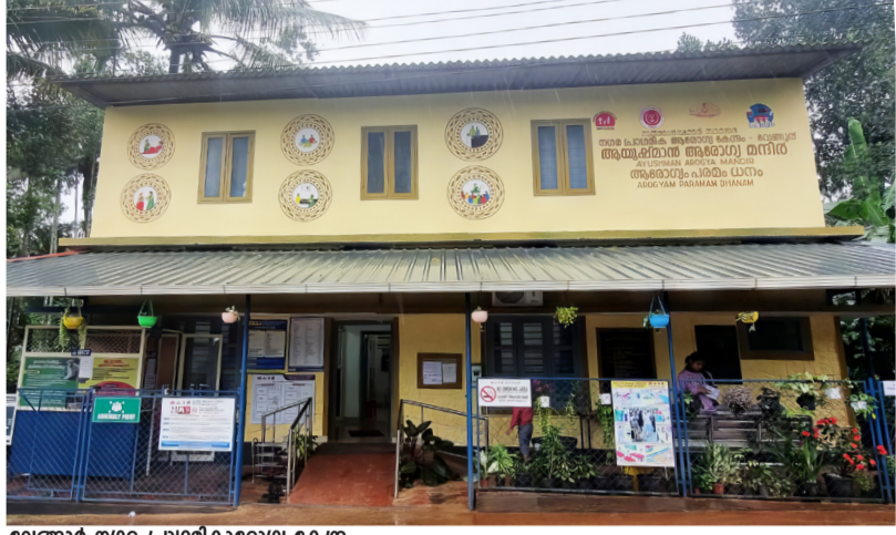
വേങ്ങൂർ നഗര പ്രാഥമികാരോഗ്യ കേന്ദ്രം

ഇടുങ്ങിയ പാതകളിൽ സഞ്ചരിക്കാൻ കഴിയുന്ന ബൈക്ക് ഫീഡർ ആംബുലൻസ്, ദുർഘട പാതകളിലൂടെ സഞ്ചരിക്കാൻ കഴിയുന്ന 4x4 റെസ്ക്യൂ വാൻ, ഐ.സി.യു ആംബുലൻസ് എന്നിവ ഇതിൽ ഉൾപ്പെടുന്നു. കനിവ് 108 ആംബുലൻസ്