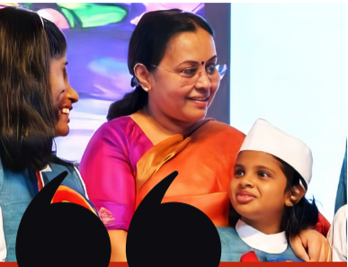
വിരയിളക്കൽ കുട്ടികളിലെ വിളർച്ച ഒഴിവാക്കുന്നു, ആരോഗ്യകരമായ വികാസത്തിനു സഹായകരമാകുന്നു

കുന്നതായും ലോകാരോഗ്യ സംഘടനയുടെ കണക്കുകൾ പ്രകാരം ഇന്ത്യയിൽ 1 മുതൽ 14 വയസ് വരെയുള്ള 64% കുട്ടികളിൽ വിരബാധയുണ്ടാകുവാൻ സാധ്യതയുണ്ടെന്നും അവർ ചൂണ്ടിക്കാട്ടി. ഇതിന്റെ അടിസ്ഥാനത്തിൽ ശക്തമായ ഇടപെടലുകളാണ് ആരോഗ്യ വകുപ്പ് നടത്തി വരുന്നത്. ഏറ്റവും ബൃഹത്തായ പൊതുജനാരോഗ്യ പരിപാടികളിൽ ഒന്നായ വിര നിർമ്മാർജ്ജന പരിപാടിയിൽ ആരോഗ്യവകുപ്പിനൊപ്പം സഹകരിച്ച വിദ്യാഭ്യാസ-വനിതാശിശു വികസന വകുപ്പുകളുടെ സംഭാവനകളെയും മന്ത്രി അനുഭവമുദിച്ചു. എല്ലാ കുട്ടികളും വിര നശീകരണത്തിനുള്ള ഗുളിക കഴിച്ചുവെന്ന് മാതാപിതാക്കൾ ഉറപ്പാക്കണമെന്നും മന്ത്രി അഭ്യർത്ഥിച്ചു.