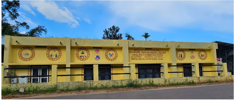
പിലാക്കാവ് നഗര ജനകീയ ആരോഗ്യ കേന്ദ്രം