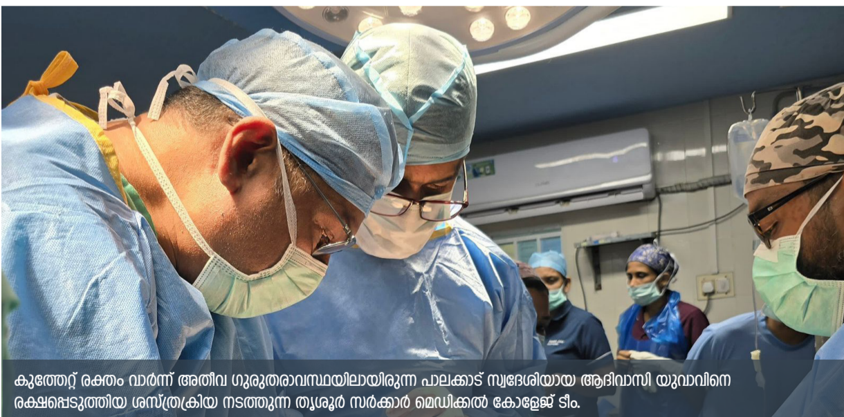
കുത്തേറ്റ് രക്തം വാർന്ന് അതിവ ഗുരുതരവസ്ഥയിലായിരുന്ന പാലക്കാട് സ്വദേശിയായ ആദിവാസി യുവാവിനെ രക്ഷപ്പെടുത്തിയ ശസ്ത്രക്രിയ നടത്തുന്ന തൃശൂർ സർക്കാർ മെഡിക്കൽ കോളേജ് ടീം.

തിരുവനന്തപുരം: ഇടത് തോളെല്ലിന് താഴെ ആഴത്തിൽ കുത്തേറ്റ് രക്തം വാർന്ന് അതിവ ഗുരുതരവസ്ഥയിലായിരുന്ന പാലക്കാട് സ്വദേശിയായ ആദിവാസി യുവാവിനെ (25) രക്ഷപ്പെടുത്തി തൃശൂർ സർക്കാർ മെഡിക്കൽ കോളേജ്. ഹൃദയത്തിൽ നിന്നും നേരിട്ട് പുറപ്പെടുന്ന ധമനിയായ സബ് ക്ലേവിയൻ ആർട്ടറിക്ക് ഗുരുതര ക്ഷതം പറ്റിയതിനാൽ രക്ഷിച്ചെടുക്കുക പ്രയാസമായിരുന്നു. സമയം നഷ്ടപ്പെടുത്താതെ സർജനി വിഭാഗത്തിന്റെ നേ