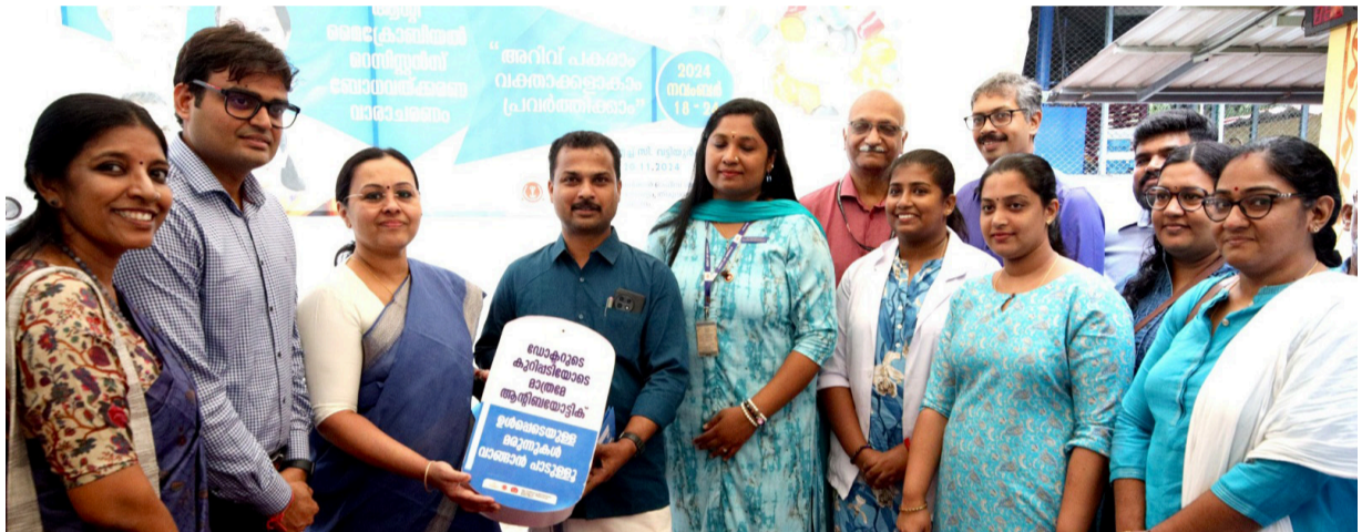
ആന്റിബയോട്ടിക്കുകളുടെ അമിത ഉപയോഗത്തിനെതിരെയുള്ള ബോധവൽക്കരണത്തിന്റെ സംസ്ഥാനതല ഉദ്ഘാടന ചടങ്ങ്. വാർത്ത പേജ് എഴുതിൽ ഡയറിക്കാം...

യോക്രൂറുടെ നിർദ്ദേശപ്രകാരമല്ലാതെ തന്നെ സ്വയം ആന്റിബയോട്ടിക്കുകൾ മെഡിക്കൽ സ്റ്റോറുകളിൽ നിന്ന് വാങ്ങിക്കഴിക്കുക, യോക്രൂറുടെ കുറിപ്പടിയില്ലാതെ മെഡിക്കൽ സ്റ്റോറുകളിൽ നിന്ന് ആന്റിബയോട്ടിക്കുകൾ വീൽക്കുക, ബാക്റ്റീരിയ മുലമുള്ള അണുബാധയാണെന്നു കൃത്യമായി വിവരിച്ചിട്ടില്ലാത്ത അനാവശ്യമായി ആന്റിബയോട്ടിക്കുകൾ കുറിച്ചു നൽകുക,