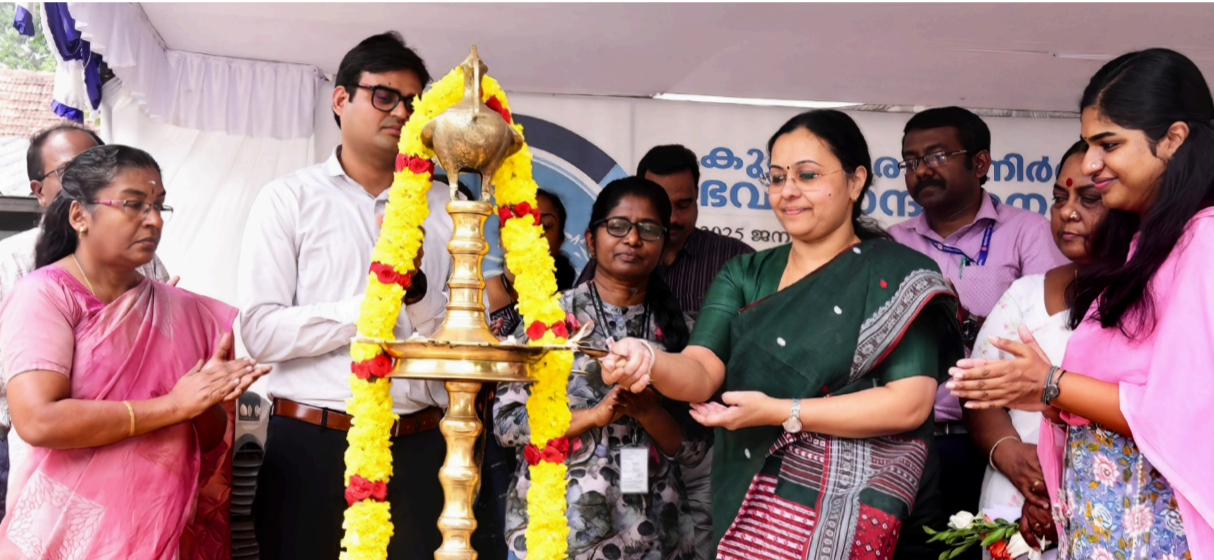
ആരോഗ്യ വകുപ്പിന്റെ നേതൃത്വത്തിൽ സംഘടിപ്പിക്കുന്ന 'അശ്വമേധം 6.0' ക്യാമ്പയിന്റെ സംസ്ഥാനതല ഉദ്ഘാടനം ആരോഗ്യ വകുപ്പ് മന്ത്രി വീണാ ജോർജ്ജ് നിർവഹിക്കുന്നു.

കുഷ്ഠരോഗത്തെ പൂർണ്ണമായും തുടച്ചു നീക്കും