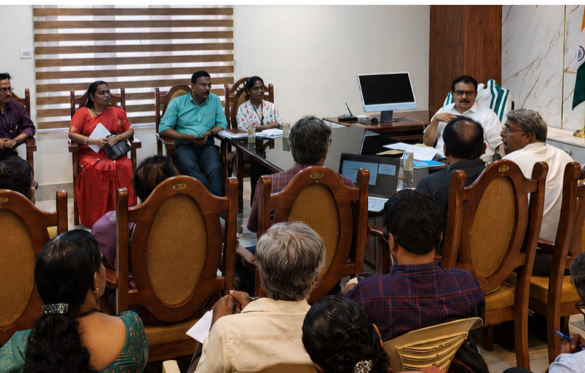
മഴക്കാലപൂർവ്വ രോഗ പ്രതിരോധ മുന്നൊരുക്ക പ്രവർത്തനങ്ങൾ ചർച്ച ചെയ്യുന്നതിനായി ആരോഗ്യ ദേവസ്വം വകുപ്പ് മന്ത്രി കെ മുരളീധരൻ നേതൃത്വത്തിൽ ചേർന്ന ഉന്നതതല യോഗം.

മന്ത്രി കെ. മുരളീധരന്റെ നേതൃത്വത്തിൽ ഉന്നതതല യോഗം ചേർന്നു